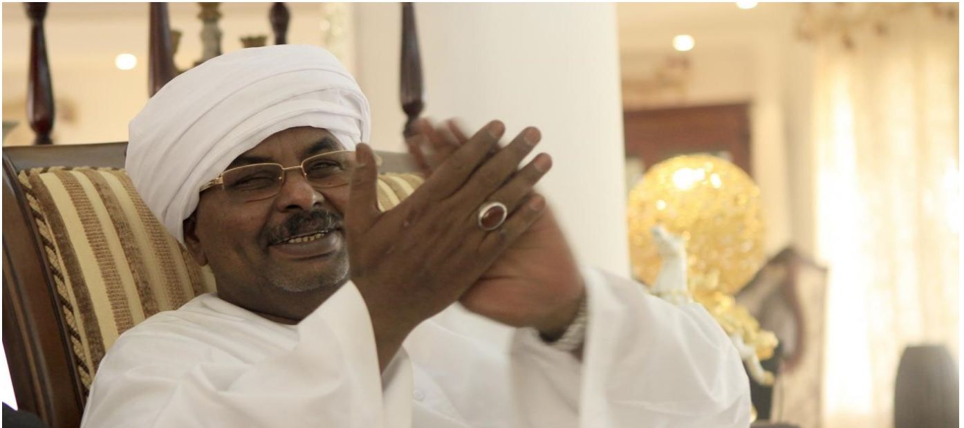
Salah Gosh, ketika berada di sebuah rumah di Khartoum pada tahun 2013 iaitu selepas dibebaskan dari penjara kerana terlibat dalam plot melakukan rampasan kuasa Presiden Sudan.